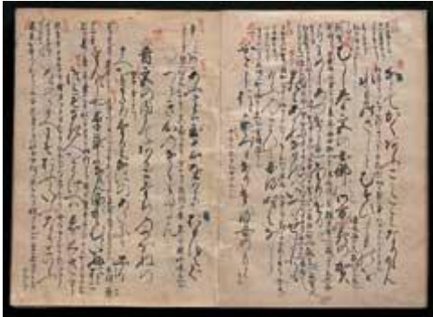
<図2> 浦添家本『伊勢物語』

*参考：池宮正治「沖縄の文学に及ぼした『源氏物語』」 （『国文学解釈と観賞』第40巻5号）