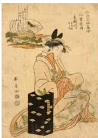
図1「和歌三神扇合 松葉屋内 喜瀬川」(九曜文庫蔵) <図1>

19世紀には、柳亭種彦による翻案小説『脩（にせ）紫田舎源氏』が、爆発的なブームを巻き起こした。これは平安の王朝文学を、室町時代の足利将軍家のお家騒動に移し替え、光源氏の代わりに、武勇と美貌を兼ね備えた主人公、足利光氏が好色を装いながら逆臣の陰謀に立ち向かうストーリーで、庶民の人気を博した。